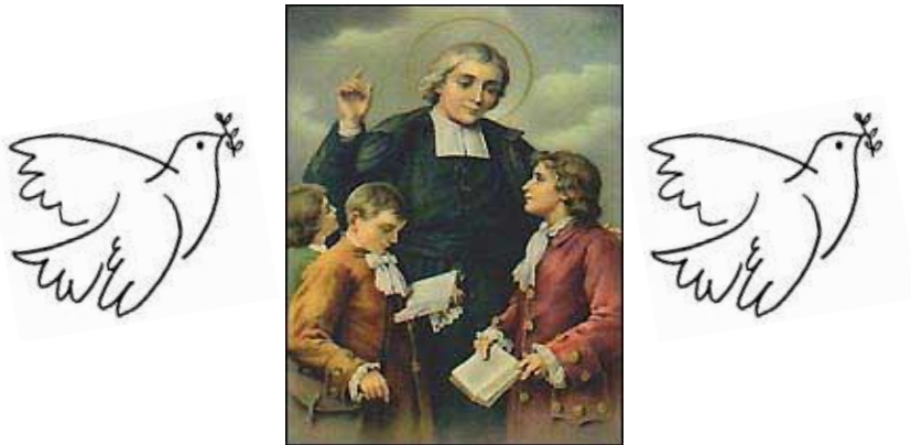
SAN JUAN BAUTISTA DE LA SALLE Fundador de la Congregación De las Escuelas Cristianas