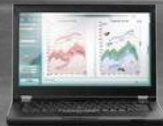
Visualización del habla (opcional)