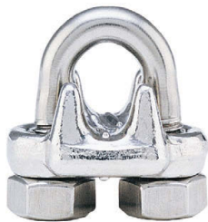
SS-450 Grapas de Acero Inoxidable para Cable

*Pernos en U y tuercas electrochapados. ** La base de la de 2-3/4" y 3-1/2" es de acero fundido.